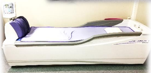
ウォーターベッドマッサージ