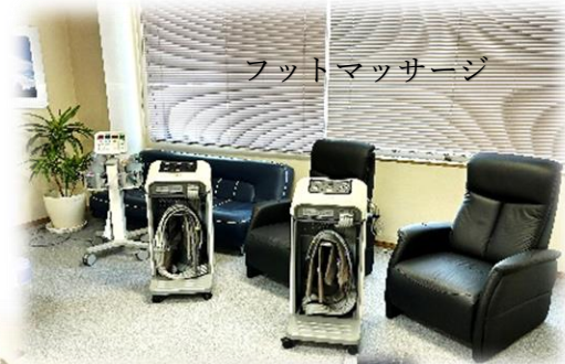
フットマッサージ